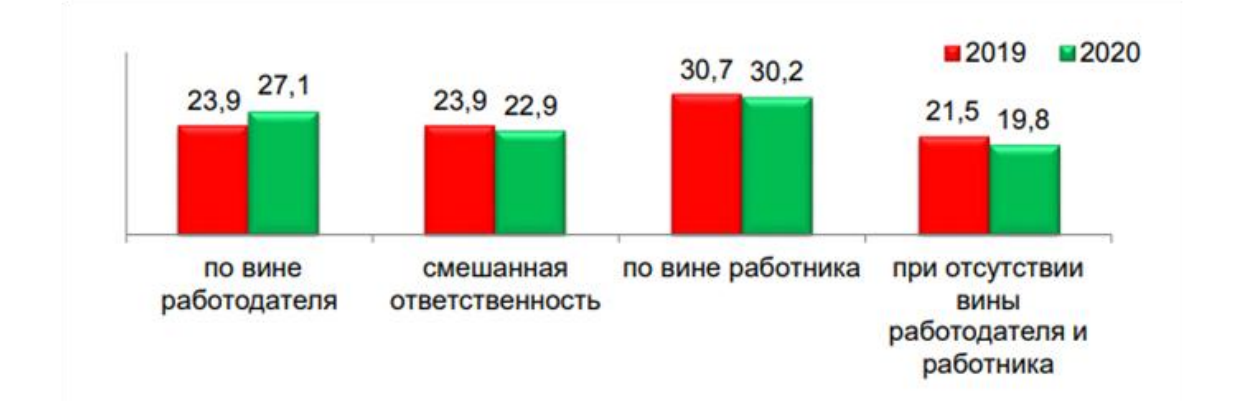
Рис.4 Распределение ответственности по случаям со смертельным исходом, %