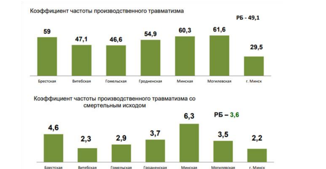
Рис.2 Коэффициенты частоты производственного травматизма в разрезе регионов за 2020 год, случаев на 100 тыс. застрахованных.