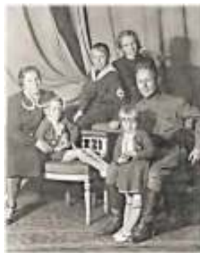
М. Шолохов с женой и детьми

В 1924 году напечатан первый рассказ писателя — «Родинка» (открывший впоследствии книгу «Донские рассказы»). Уже в этом раннем произведении Шолоховым очерчена магистральная тема дальнейшего творчества — жестокость и безжалостность времени, когда рушится устоявшийся веками уклад жизни и рвутся самые тесные связи, а родные и близкие люди оказываются по разные стороны баррикад.