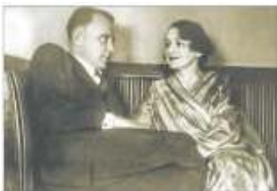
Михаил Афанасьевич и Елена Сергеевна

твёрь»). В 1939 году писатель с женой выехали в Грузию для начала работы над постановкой, но в дороге им пришла телеграмма о её отмене.