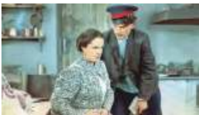
Кадр из фильма «Тихий Дон» (реж. С. Герасимов, 1957)

(на берегу Дона играет с ледяными сосульками Мишатка). Дон олицетворяет сильную, древнюю и равнодушную стихию. Писатель и литературовед Дмитрий Быков в статье «Дикий Дон», проводя параллель с эпопеей Л. Толстого, так трактует смысл названия: «Если пафосом “Войны и мира” было именно пробуждение человеческого в человеке под действием событий экс-