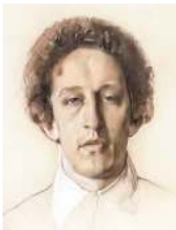
К. Сомов. Портрет А. Блока