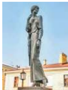
Памятник Анне Ахматовой в Санкт- Петербурге напротив тюрьмы «Кресты»

В город, где у тюремной стены будет воздвигнут нерукотворный памятник духовному «я» поэта, разделившего со своим народом все его беды, обязательно вернутся пространство и время. Голубь в библейские времена принёс Нюю весть о прекращении Всемирного потопа — голубь в новом Ленинграде со съёт гнездо где-то вдали от опустевших тюремных стен. Ад закончится, река, которая снова потечёт и даст путь кораблям, станет символом восстановления правильного, установленного Господом движения жизни. Заканчивая поэму в 1940 году, Анна Ахматова предвидела это время и потому в двух последних двустихиях выбрала форму повелительного