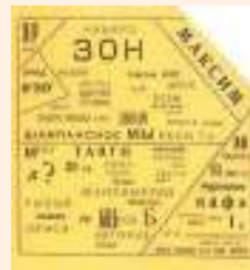
Одно из стихотворений В. Каменского

Участники группы «Гилея» назывались кубофутуристами и резко противопоставляли себя другим футуристам. Почти все они занимались не только поэзией, но и живописью, что также отражалось в их стихотворениях: большое значение придавалось визуальному воздействию текста (фигурное построение, разные шрифты, лесенка и т. п.). Например, Василий Каменский расчерчивал страницу на неправильные многоугольники и заполнял их словами или частями слов.