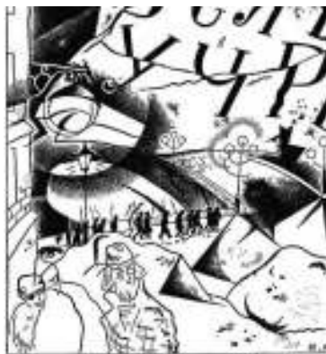
Ю. Анненков. Иллюстрация к поэме «Двенадцать»

В поэме создаётся собирательный образ народа . Следуя принципу историзма, Блок, воодушевлённый идеей социальных преобразований, выдвигает на передний план демократические массы. Из самых низов российского общества собран отряд красногвардейцев. Они полны жажды мщения, подвижны «святой злобой». Опьянённые свободой, грабят, устраивают