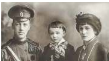
А. Ахматова с мужем Н. Гумилёвым и сыном Львом

навсегда в жизнь и творчество Ахматовой войдёт имя Александра Пушкина. Он станет для неё образцом в поэтическом мастерстве. «На каждой её странице незримо присутствует Пушкин. Каждая её строчка отлично сработана, сделана раз навсегда», — утверждал К. Чуковский 1 . Все последующие годы Ахматова «усердно и с большим интересом», как она сама