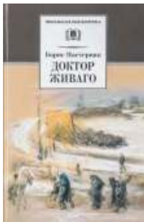
Б. Пастернак. «Доктор Живаго»