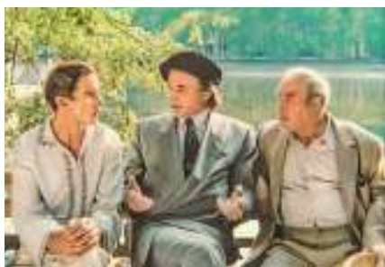
Кадр из фильма «Мастер и Маргарита» (реж. Ю. Кара, 1994)

ру действительности. В романе более 500 персонажей, более 100 из них наделены собственными именами. Жившие сотни и тысячи лет назад герои предстают такими же живыми и реальными, как и современные автору москвичи. «Московские» и «ершалаимские» главы расположены в романе так, что у читателя создаётся впечатление синхронности, как будто события тысячелетней давности происходят одновременно с современными. Помимо трёх основных крупных ми-