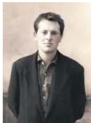
Поэт в 1963 году

В 1964 году состоялся суд над поэтом. Стенограмма процесса, тайно сделанная журналисткой