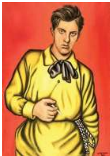
Н. П. Петрова (Ходасевич-Леже). В. В. Маяковский в 1910 году

В 1914 году и Маяковского, и Бурлюка исключают из училища. Для обоих это прошло почти незамеченным: Владимир поглощён творчеством, а Давид занят планированием гастролей футуристов. Благодаря организационному таланту Бурлюка их турне прошло с огромным успехом и длилось почти три месяца.