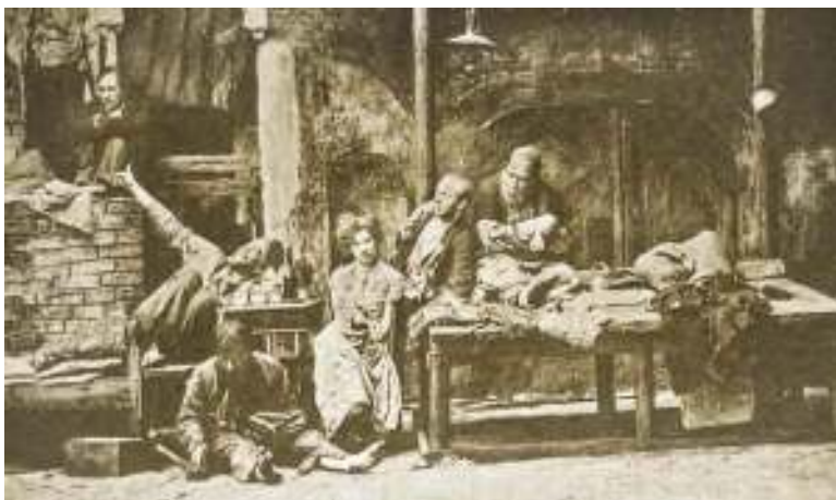
Постановка в МХТ в 1902 году

ночлежки. Позже Горький признавал, что «...речь Сатина о человеке-правде бедна. Однако — кроме Сатина — её некому сказать, и лучше, ярче сказать — он не может. Уже и так эта речь чуждо звучит его языку».