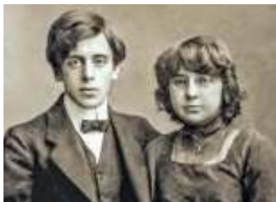
М. Цветаева и С. Эфрон

Вскоре один за другим выходят два сборника её стихов — «Волшебный фонарь» (1912) и «Из двух книг» (1913). Эти книги продолжают и развивают уже прозвучавшие ранее мотивы камерной лирики, но в них отчётливо проявилась несомненная творческая самобытность автора. Критики отмечали: стихи Цветаевой узнаются безошибочно по «стремительности рвущегося ритма, особой интонации, тонкому лиризму личных переживаний». Читателей поражал тон твёрдой уверенности автора в своих творческих силах, избранном призвании.