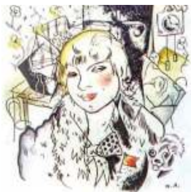
Ю. Анненков. Иллюстрация к поэме «Двенадцать»

На контрасте с Ванькой выписан невольный убийца Катьки Петруха. Самое поэтичное в нём — это любовь-страсть к Катьке, чувство, не покидающее его наперекор рассудку. Безрассудная месть овладевает Петькой и бросает в погоню за тройкой с «еликстрическим фонариком на оглобелях». Искренни страдания «бедного убийцы», оформленные в похожем на плач монологе-причитании: «Ох, товарищи родные, // Эту девку я любил...» Далее хаос чувств упорядочивается идеей долга и служения революции — Петруха вместе с товарищами продолжает «державным шагом» нести дозор.