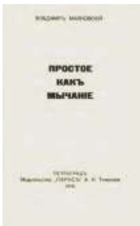
Сборник «Простое как мычание» (1916)

проявляется во всём: неточной и составной рифме, рваном ритмическом рисунке, подчёркнутом неблагозвучии и неологизмах, намеренном нарушении синтаксических и словообразовательных норм.