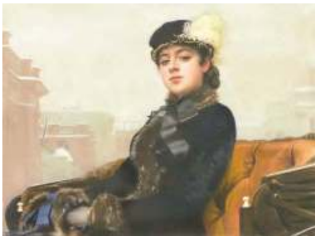
И. Крамской. Неизвестная

женой. От образа незнакомки тянутся нити к героине стихотворения «Железная дорога», родственна она и Катьке в поэме «Двенадцать». Современники видели в девушке воплощение героинь Тургенева, Толстого, Достоевского. Название стихотворения прямо отсылало читателей к популярнейшей картине И. Крамского «Неизвестная» (1883), вызвавшей в своё время множество слухов и догадок. Сам А. Блок говорил, что увидел свою героиню на полотнах М. Врубеля.