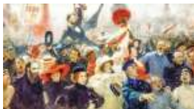
И. Е. Репин. Манифестация 17 октября 1905 года

Литература военного периода воспела подвиг советского народа в годы Великой Отечественной войны (1941—1945), моральную силу и стойкость людей, защитивших свою землю и весь мир от фашизма.