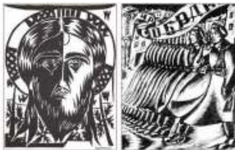
Н. Гончарова, И. Фридлендер. Иллюстрации к поэме «Двенадцать»

Трудно расшифровать смысл поэтических деталей в изображении Христа: он «в белом венчике из роз», а не в привычном терновом венце, в руках Христа «кровавый флаг». Каким смыслом наполнена деталь, если флаг — атрибут революционного движения, а эпитет «кровавый» однозначно ассоциируется с гибелью и трагедией?