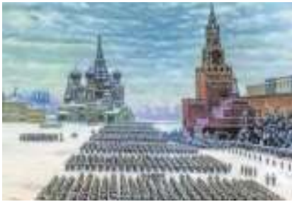
К. Ф. Юон.

Парад на Красной площади в Москве 7 ноября 1941 года