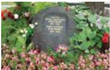
Могила М. Булгакова на Новодевичьем кладбище

10 марта 1940 года писатель скончался. На Новодевичьем кладбище в месте его захоронения установлен необычный памятник — огромный камень с могилы Н. Гоголя, которого М. Булгаков считал своим учителем.