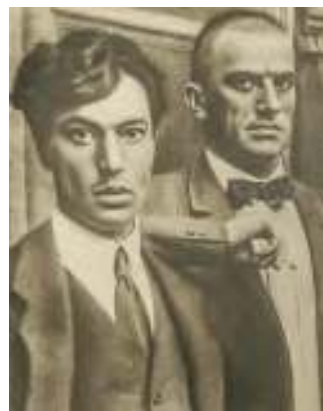
Б. Пастернак и В. Маяковский, 1924

В 1930—1940-е годы. В 1932 году выходит книга стихов Пастернака «Второе рождение», в которой критики отметили поворот поэта к новой, менее метафоричной и более простой стилистике. Тридцатые годы не были простыми для Пастернака. С одной стороны, он становится довольно знаменит, имя его широко известно, на Первом съезде советских писателей в 1934 году его поэзии даётся высокая оценка. Но с другой — убеждения диктуют ему не поддаваться нажиму официальной советской критики, всё настойчивее предлагавшей Пастернаку задуматься, «куда ведёт его путь индивидуализма, цехового высокомерия и претенциозного зазнайства». Пастернаку всегда была чужда позиция отвлечённого наблюдателя, он умел высказываться очень твёрдо и даже резко, стремился открыто отстаивать свои убеждения, старался заступаться за тех, кто подвергался несправедливым гонениям. В том же 1934 году Пастернак просит за арестованного Осипа Мандельштама, чем вызывает недовольство Сталина, позже отказывается подписать «гневное одобрение» расстрелу советских военачальников М. Тухачевского, И. Якира и др. Всё это послужит началом тяжёлого душевного и творческого кризиса, вызванного