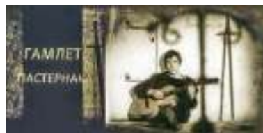
Читает В. Высоцкий

отведённую ему роль, — а театр жизни, и в нём герой ощущает себя Гамлетом своего времени. Он пока ещё находится в начале пути, но уже «ловит в далёком отголоске» недобрые вести, различает «в сумраке ночи», наставленной на него «тысяче биноклей» враждебный гул толпы против одиночки, осмелившегося противостоять всеобщему ханжеству, лицемерию и лжи, в которых «тонет» его страна.