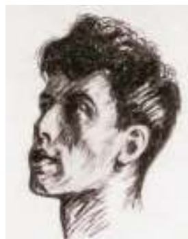
Портрет Б. Пастернака, выполненный его отцом Л. Пастернаком

В заключительной строфе лирический герой уже несколько иначе понимает всеобщее смятение. Он видит в пешеходе «убелённого» не только снегом, но и сединой странника, в «удивлённых растениях» —