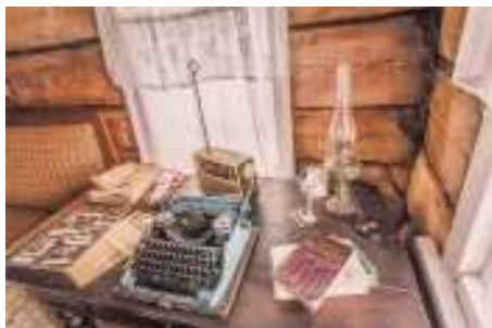
Рабочий стол поэта в деревне Норенская

и писательницей Фридой Вигдоровой, попала в зарубежную печать. Поэт был приговорён к максимально серьёзному наказанию по указу о тунеядстве — пяти годам ссылки.