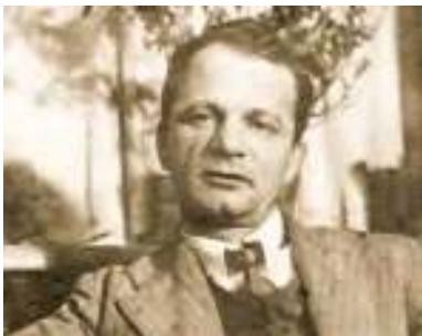
Андрей Платонов. Конец 1930-х годов

Творчество и судьбу Платонова в 1940-е годы определили военные события. В годы Великой Отечественной войны Платонов как военный корреспондент участвует в боях на территории Беларуси.