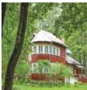
Дача Б. Пастернака в посёлке Переделкино

В 1936 году Пастернак получает зимнюю дачу в подмосковном Переделкине, где отныне будет проходить основная часть его жизни. Пастернак чувствует себя в этом посёлке «так, как будто сам создал его по своему образу и подобию». Он с удовольствием топит печи, вскапывает огород: