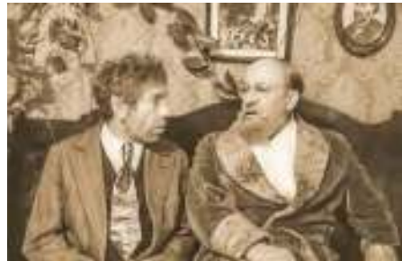
Кадр из фильма «Собачье сердце» (реж. В. Бортко, 1988)

Повесть в фантастической и сатирической форме выносит приговор большевистской идеологии. Профессор Преображенский, выдающийся учёный и хирург, со своим помощником доктором Борменталем выполняют уникальную операцию: пересаживают человеческий гипофиз дворовой собаке Шарик. В результате умный и смекалистый пёс превращается в очень неприятное человеческое существо, Полиграфа Полиграфовича Шарикова. Он разрушает быт Преображенского, крадёт у него деньги, пишет донос и стремится отнять часть жилплощади. Профессор, убеждаясь в опасности и бесполезности своего эксперимента, проводит вторую операцию, и Шариков постепенно вновь становится собакой.