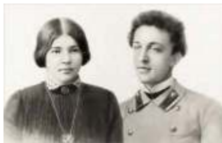
А. Блок и Л. Менделеева

Один из путей спасения человечества подсказывает теория двоемирия Платона, усмотревшего в земной жизни отображение высшей сферы бытия. Особые надежды связаны с приходом на землю Пречистой Девы, Вечной Жены, воплощающей Душу Мира. К служению таинственной Деве призывает «властитель дум» молодёжи В. Соловьёв, ему вторят ученики-«соловьёвцы». В обществе складывается миф об ожидаемом пришествии Её — Прекрасной Дамы, Владычицы Вселенной. Мировая Душа окутана тайной, это некая «единая внутренняя сущность мира».