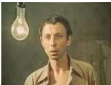
Олег Даль в роли Зилова. Телефильм «Отпуск в сентябре» (1979)

в церкви... А ночь? Боже мой! Знаешь, какая это тишина? Тебя там нет, ты понимаешь? Нет! Ты ещё не родился. И ничего нет. И не было. И не будет...»