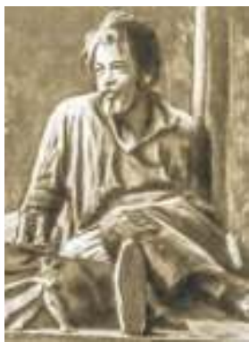
К. Станиславский в роли Сатина

Лука и Сатин: большой спор о человеке. Философскую направленность разговор о человеке получает с явления на сцене Луки. В ночлежке сошлись два философа-«идеолога», несущих две правды о человеке. «Утешительный» гуманизм заложен в теории Луки — жёсткой правдой руководствуется в отношении к жизни Сатин. Этим героям доверил автор ключевые мысли о человеке.