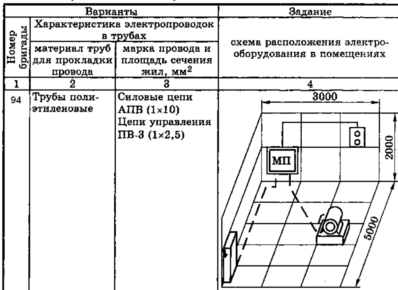
Таблица 2 – Варианты задания к вопросам 94-101